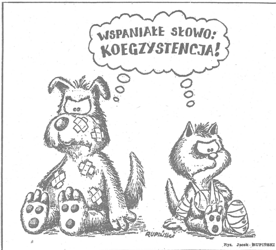
Das herrliche Wort Koexistenz.

kann von der sozialistischen Revolution keine Rede sein» (Lenin, AW, I/430).