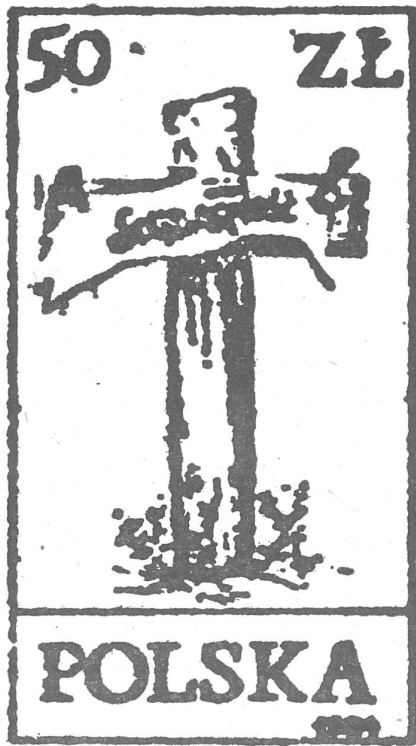
Briefmarke der Untergrund-Solidarnosc: Die gekreuzigte Solidarität.