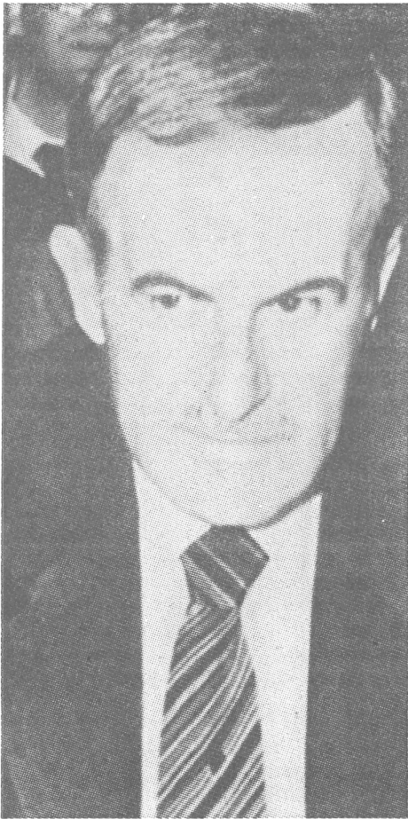
Massgeblich für Libanon: der syrische Präsident Hafez Assad.

Weg dahin lag nebst einem guten Dutzend sunnitischer Dörfer auch das Palästinenserslager Badawi. Die Gegend war feindlich geworden, und den durchziehenden Dorfbewohnern drohten Verhaftungen, Entführungen und Gewalttätigkeiten. Die Drohung kam einmal von den Palästinensern und dann auch von der syrischen Armee.