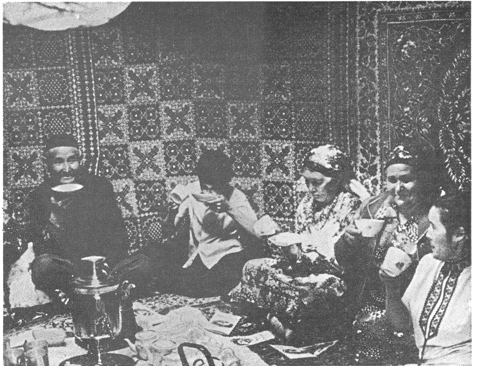
Moslemfamilie in Sowjetasien.

Doch gibt der ausländische Einfluss in Aserbaidshan und Turkmenistan wegen ihrer ge-