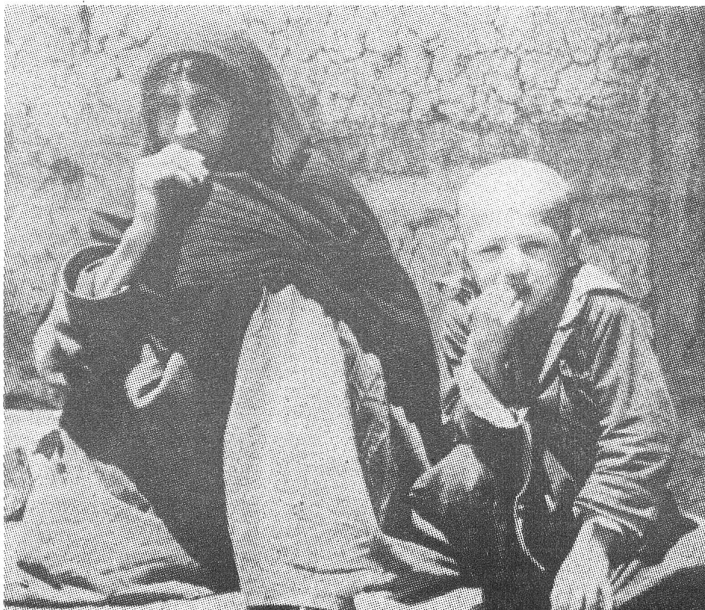
Afghanische Flüchtlinge. Bild:

Ein Hauptproblem stellt für die Sowjets aber die Tatsache dar, dass sich ihre militärische Übermacht nicht in einer Beruhigung an der zivilen Front niederschlägt. Die Besatzungsarmee war nicht in der Lage, eine effiziente Verwal-