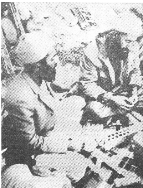
Mujahedin bei der Waffenausbildung.

SOI-Hilfsfonds Afghanistan PC 30-4474 Bern