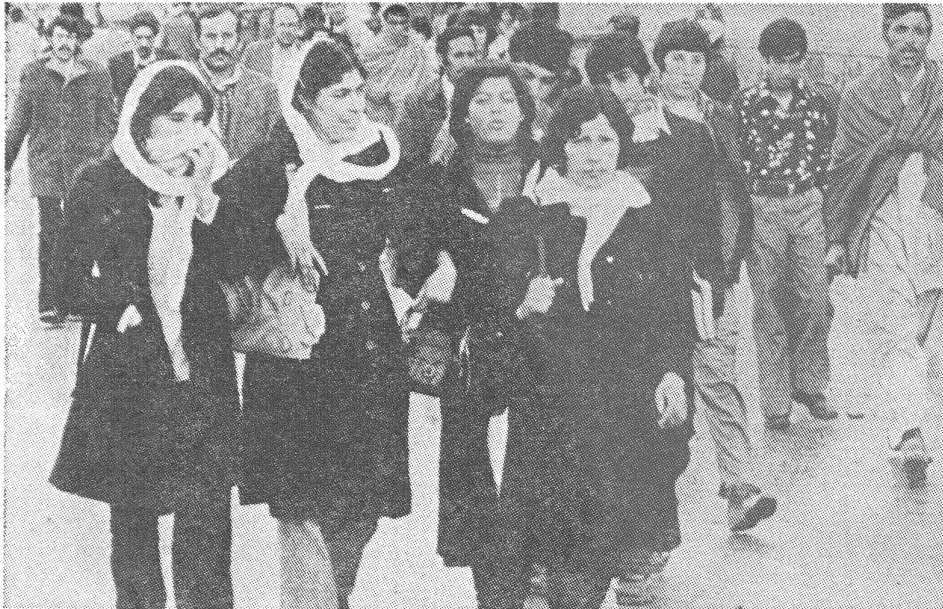
Studenten in Kabul. Die Ränge werden mit Tudeh-Leuten aus Iran aufgefüllt.

tung aufzubauen, das heisst Dörfer, Distrikte und Provinzen unter politische Kontrolle zu bringen. Hauptursache dafür ist der Umstand, dass die Besatzungsarmee nicht einmal ihren engsten Freunden oder den Mitläufern trauen kann. Die Kraft der Religion und des Patriotismus, die tiefen Bindungen an die traditionellen Werte wie Familie, Sippe und Stamm sind die Barrieren, an denen die sowjetische Infiltration scheitert. Das hat zur Folge, dass überall im öffentlichen Leben, in Schlüsselstellen wie in tieferen Positionen, KGB-Berater präsent sind. Zum Schutz des Staatspräsidenten Babrak Karmal wurden 200 KGB-Agenten abgestellt. Der «grosse Führer der afghanischen Revolution und Sohn der Arbeiterklasse» muss sich sogar, aus Angst vor Vergiftung, seine Mahlzeiten