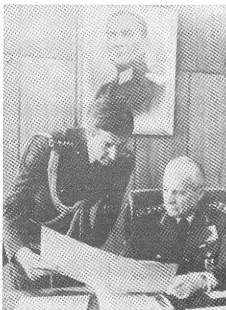
General Kenan Evren, Staatspräsident: auf militärischer Marschroute zum Zivilregime.