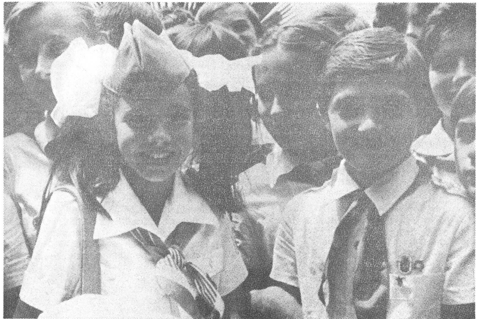
Und für die (vorrangig militärisch gestaltete) Freizeit die Uniform der «Jungen Pioniere».