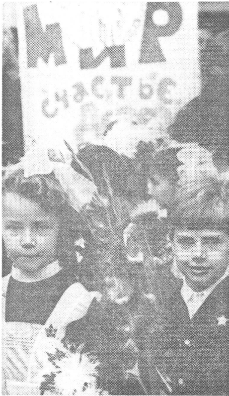
Auf dem Hintergrund von «Frieden» (siehe Text nebenan) und «Glück» die uniformierten Kinder; das Schulkleid des Mädchen mit «stets schneeweissem Kragen».

chen Zeitung vor; falls sie einen andern Ton angeschlagen hätten, wären sie ohnehin am redigierenden Kaplan gescheitert.