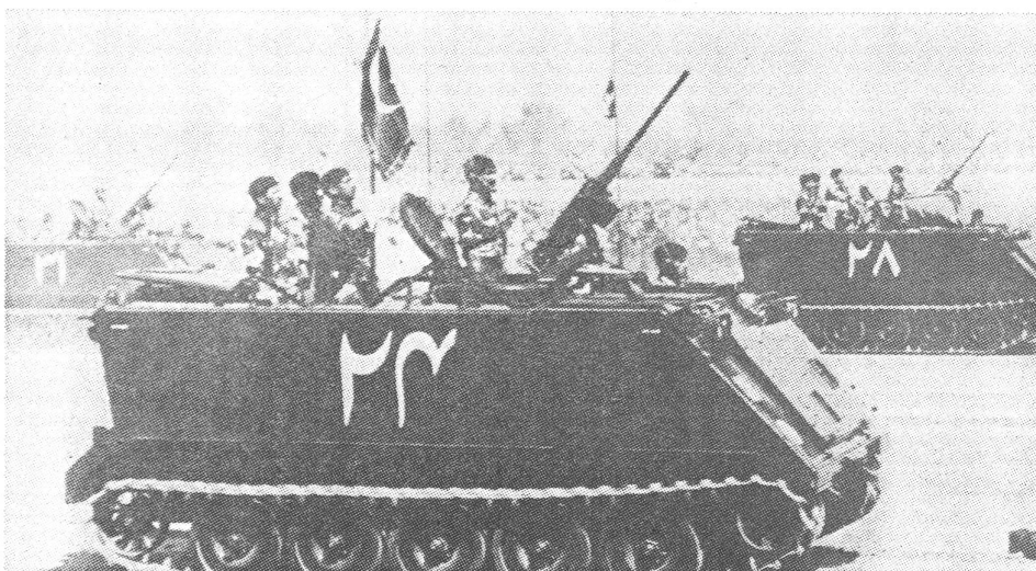
Die pakistanische Armee: Ohne internationale Solidarität keine genügenden Mittel, dem vielgestaltigen sowjetischen Druck zu widerstehen.

Wir wollen uns nicht lange bei der semantischen Korrektur aufhalten, dass sich die tatsächliche Befreiungsbewegung der Region in Afghanistan befindet; das ist ohnehin nicht gemeint, wenn es aus dem Moskauer Sprachrohr tönt. Hingegen hat das schwache Pakistan,