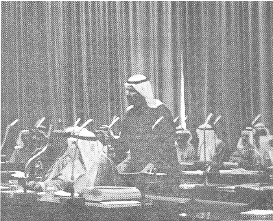
Hat der Emir von Kuwait den Vorhang schon heruntergelassen?

nicht anders als der Iran, seine Mühe mit auf-sässigen Minderheiten, und so sind des Stellvertreter Worte aus Kabul nichts anderes als eine erklärte Parteinahme für deren Kampf.