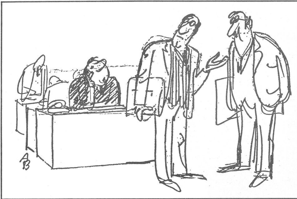
«Schauen Sie, der Typ der arbeitet überhaupt nichts.» – «Ja, Gott sei Dank.» (Aus der satirischen Zeitschrift «Starchel», Sofia)

kann man nur eine sowjetische Uhr kaufen wollen! Was hast du denn bloss gesucht?» – «Die Uhr, die ich seit Ende August 1968 vermisste.»