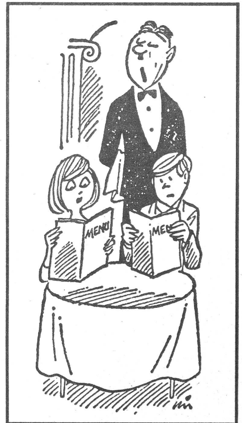
Und teuer ist das Essen in Polen auch noch. Dazu eine Karikatur von «Express Wieczorny», Warschau: «Wünschen der Herr und die Dame zum Hinunterspülen der Preise schon etwas zu trinken?»

Vor allem aber: Was die allgemeine Verursachung der laufend verschlechterten Verhältnisse angeht, so wird sie bleiben. Denn das polnische Regime hat – wie alle sozialistischen Regimes – andere Prioritäten als ihre Behebung.