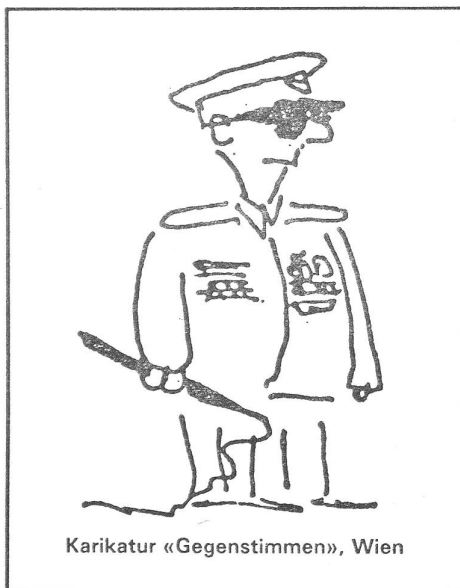
Karikatur «Gegenstimmen», Wien

Die Amnestie in Polen ist vorbehaltener Strafvollzug. Die «Begnadigten» (die keine Verbrechen begangen hatten) müssen sich zwei Jahre lang jeder Tätigkeit enthalten, die sich als Rückfall deuten liesse. «Delikte» wie Meinungsäußerung oder Informationsverbreitung können sie jederzeit wieder ins Gefängnis bringen. Das ist kein Akt der Versöhnung, sondern