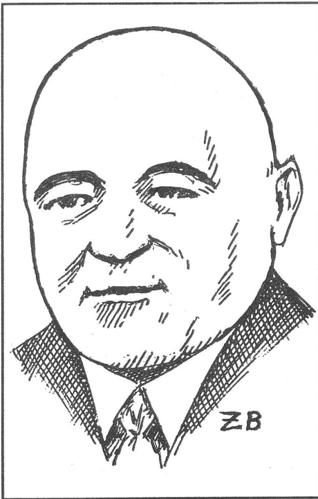
Der ungarische Diktator Matyas Rakosi. Er hat das Wort von der Salamitaktik geprägt. Aber die Sache gab es schon lange vor dem Begriff.

und dergleichen . . . , um durch einen entschlossenen Angriff des Proletariats . . . die politische Macht zu erobern.»