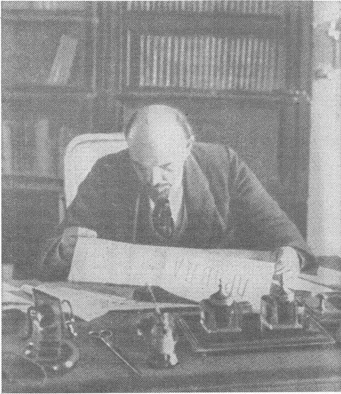
Lenin im Oktober 1918 bei der Lektüre der «Prawda».

renz fest: «Die Sowjetregierung erklärt..., dass sie nicht auf eine Veränderung der in Rumänien existierenden Sozialordnung abzielt.»