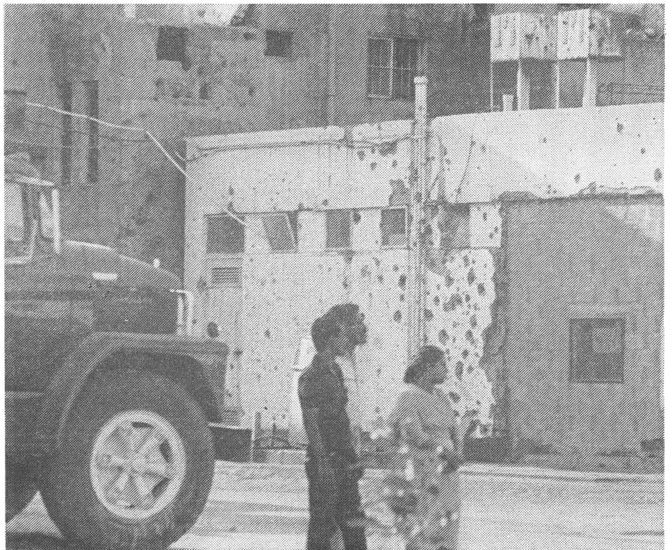
Strasse in Beirut: Wann brechen die Narben wieder auf?

Zur militärischen Szenerie gehören seit vier Jahren auch die schiitischen Amal-Milizen. Obwohl die Amal-Führung kein sonderliches Verhältnis zu Iran hat, gibt es bei den ihr angeschlossenen Gruppen auch eine Bewegung, die sich zu den Zielen von Khomeinys ismalischer