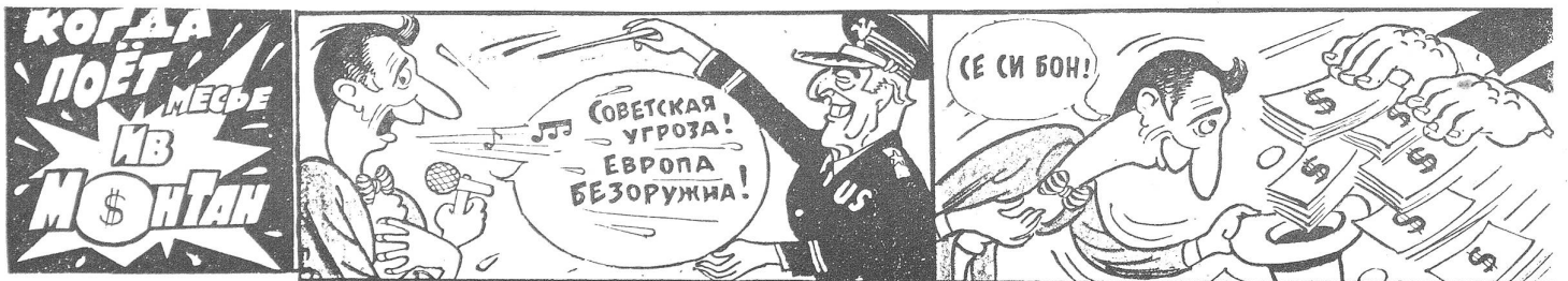
Wenn Monsieur Yves Montand singt. Mitte: «Sowjetische Bedrohung» und «Europa ist waffenlos». Rechts: «C'est si bon!» («Krokodil, Moskau, Nr. 15/1984»)