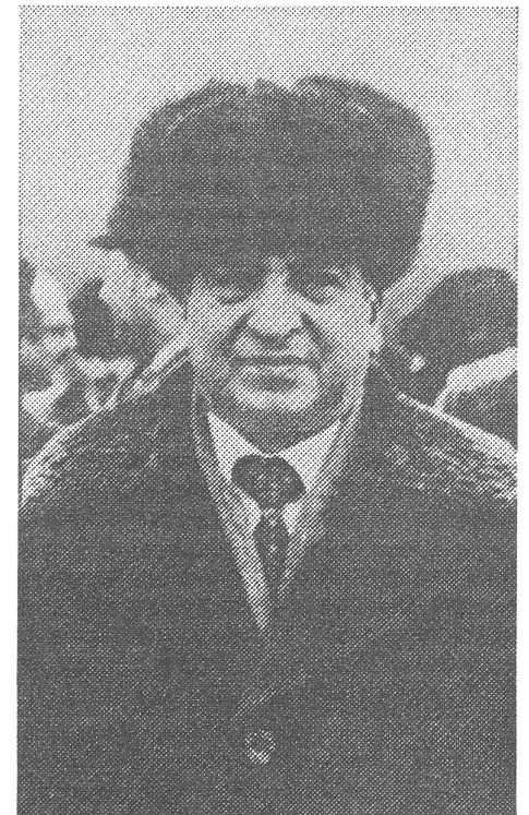
Babrak Karmal bei Besuch in Moskau.

Schahin hat über eine Anzahl von Partisanenaktionen und sowjetischen Gegenschlägen berichtet, die in der Region Kabul im März und April stattgefunden haben. Ein Beispiel: Am 19. April wurde ein militärischer Aussenposten der Regierung bei Deh-Sabz nordöstlich von Kabul durch die Mujahedin angegriffen. Als Antwort bombardierten sowjetische Kampfflugzeuge am 20. April sämtliche Dörfer des Bezirks, wobei mindestens 45 Zivilpersonen getötet wurden; gleichzeitig fand ein Angriff durch die Landstreitkräfte statt, bei dem auch die Regierungs- und Besatzungstruppen 18 Mann verloren. ■