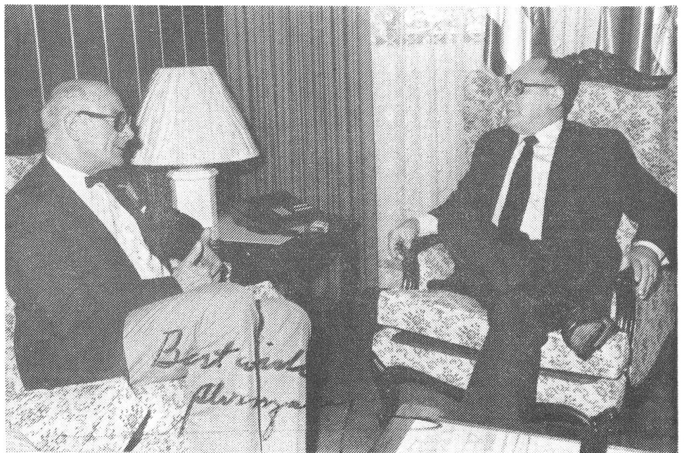
Der Autor im Gespräch mit dem am 6. Mai abgelösten Präsidenten Alvaro Magana (der die Aufnahme signiert hat).

Am 25. März standen sich der Christdemokrat Duarte, der Chef der Rechtspartei Arena, Ma-