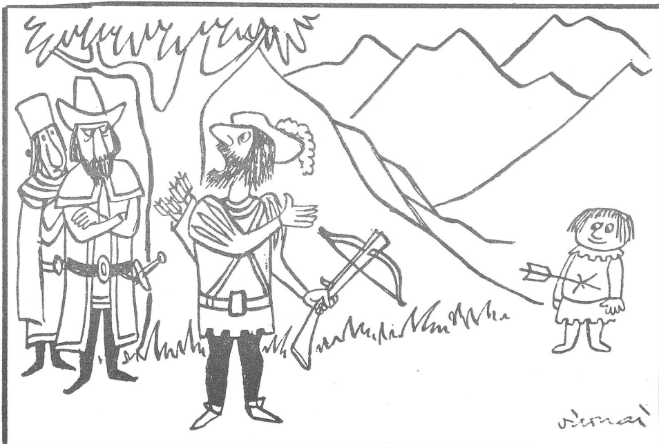
Kein Hochziel für Wilhelm Tell: «Bedaure, Herr Landvogt, aber mein Sohn ist so verfallen, dass er den Apfel schon verspiesen hat.»