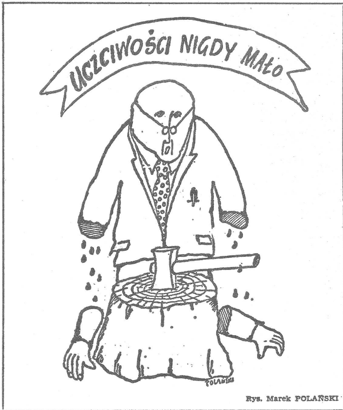
Der Zurechtgestutzte lobt die Aufrichtigkeit seiner Behandlung: