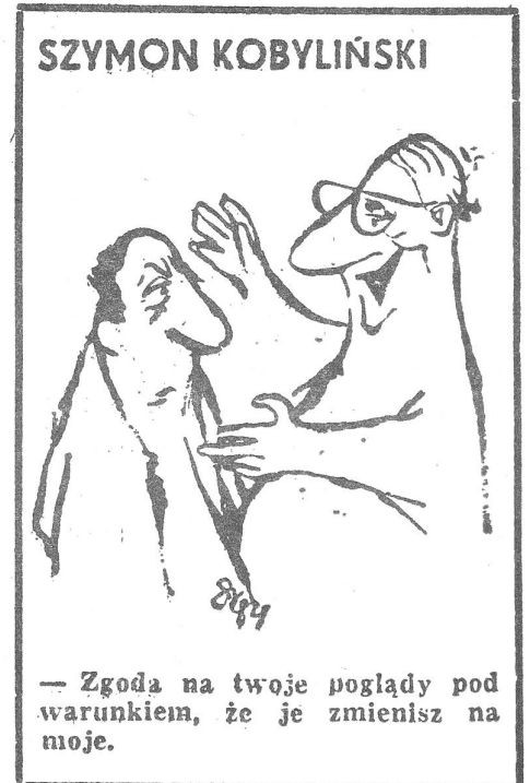
«Sobald du meine Ansichten übernommen hast, bin ich mit deinen Ansichten sehr einverstanden.» («Polityka», Warschau, 7. 4. 1984)

Im weiteren arbeitet der Sicherheitsdienst wie gewohnt mit Einschüchterung, Erpressung von Aussagen und mit der Einschleusung von Agents provocateurs. Der Aufwand ist erheblich. In Krakau allein zählte der Sicherheits-