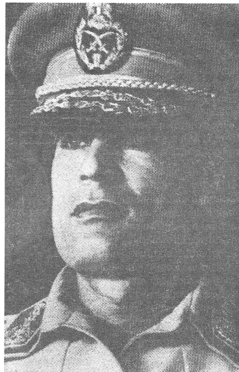
Aktiver und passiver Anreiz zum Terrorismus: Muammar el-Ghadafi.