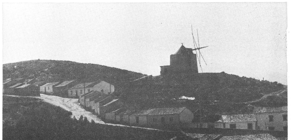
Eindunkeln auf dem Land.