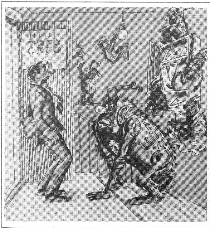
Im Forschungsinstitut «Dies und Jenes» findet der Aufstand der Computer statt, weil man ihnen doch nichts zu futtern gibt, was eines Denkapparates würdig wäre.