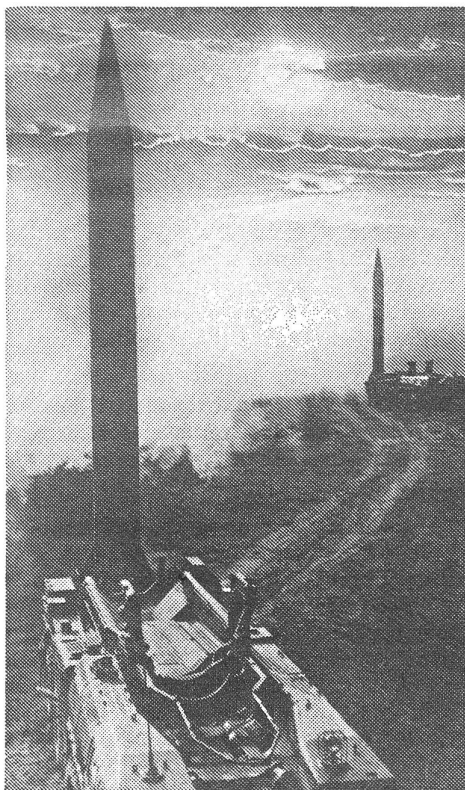
Sowjetisches Manöverbild aus der «Revue Militaire Soviétique», Moskau, Nr. 2/1984. Und interessant ist der Text der sowjetischen Bildlegende dazu:

Indessen erweist es sich heute, dass auch dieser Schein trügt.