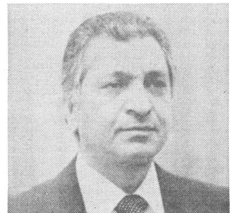
Familienangehörige und Geld nach Frankreich geschafft: Babrak Karmal.

Den ersten Grund zeige ich Ihnen an einem Beispiel. Zwischen dem 19. und dem 21. Januar und wiederum zwischen dem 23. und dem 29. Januar 1984 haben die Sowjets in zwei Wellen