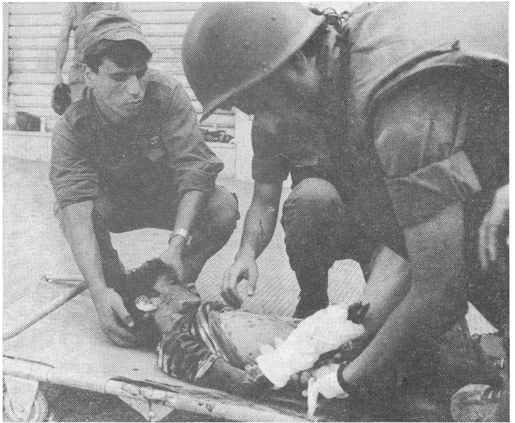
Nebst dem Golfkrieg ist die Zerstörung des Staates Libanon (Bild: Bergung eines Verwundeten in Beirut) «nur ein Vorspiel der Krisen, die noch kommen werden».

Bestimmt keinen fähigen. Der Imam Beheshti hatte politischen Verstand und organisatorisches Talent. Aber er ist bei einem Attentat umgekommen. Er hatte die Islamisch-Republikanische Partei gegründet, ebenso die Pasdaran, und er war im Begriffe, die Bauern und den Mittelstand