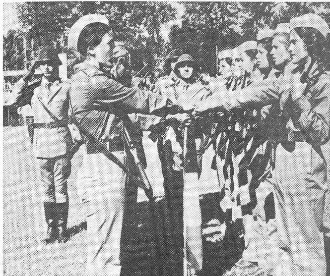
Militärische Ausbildung für rumänische Studentinnen in einem Sommerlager. Zum Abschluss werden sie auf die Fahne vereidigt.