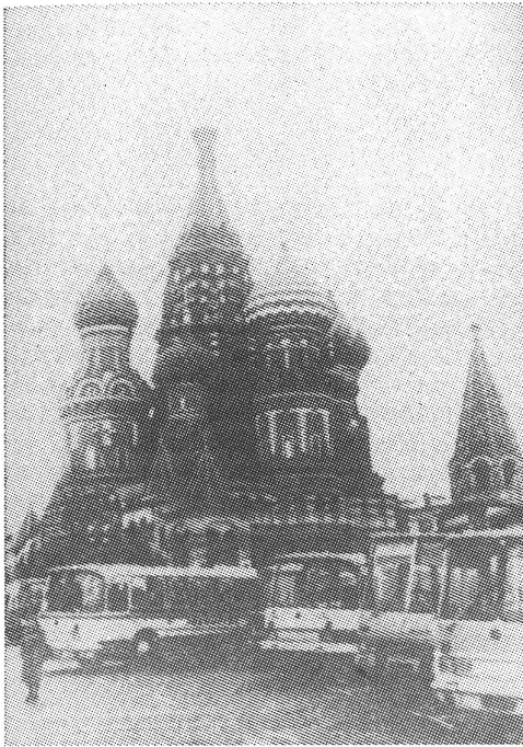
Aus dem Prospekt: Cars von Intourist in Moskau. Im Hintergrund die Basilikus-Kathedrale.

bleiben bestehen, dort ist die Zufriedenheit ein hohes Gut.»