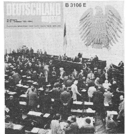
Neue Hoffnung für Frieden und Freiheit