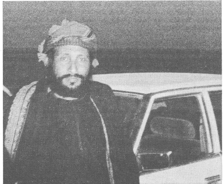
Ein Gemeindepräsident in Dhofar. Seine Bedingung zur Photo-Erlaubnis: Nur mit meinem Auto.