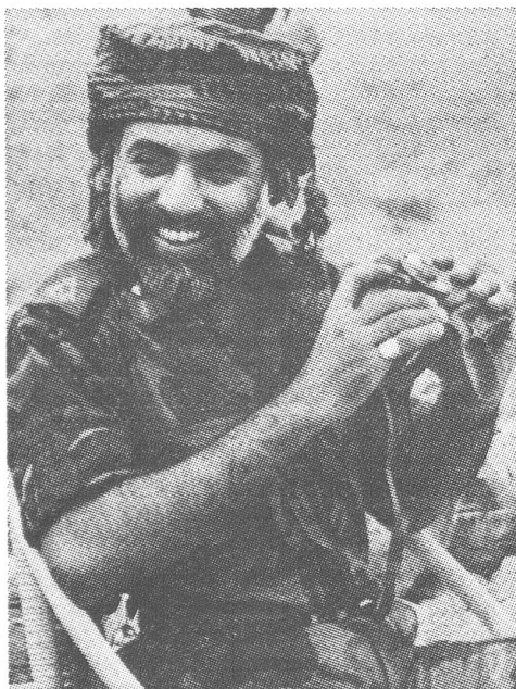
Sultan und Soldat: Kabus Ibn Said.

Auf die äussere Bedrohungslage kann man theoretisch auf zwei gegensätzliche Arten reagieren: durch Anpassung oder Widerstand. In der Praxis schliesst das eine freilich das andere nicht aus,