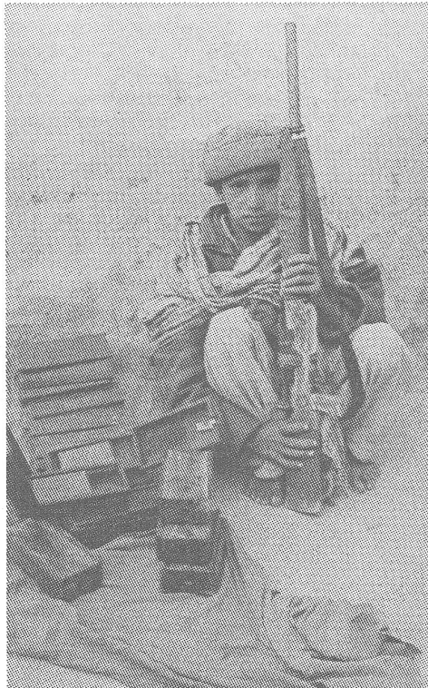
Afghanerbub mit Spielzeuggewehr neben sowjetischen Minenkisten.

haben so gut wie Sie und ich begriffen, dass die einfachen Sowjetsoldaten unschuldig am Krieg sind. Ein Anführer sagte mir, dass er nie Gefangene tötete: «Während des Kampfes hat man keine Wahl; da schießt man. Doch wenn sie dann kommen und sich ergeben, ist das eine andere Sache.» Indessen fügte er bei, dass er nur in seinem eigenen Namen sprechen wolle: «Wir können nicht für alle unsere Anführer verantwortlich sein. Sie müssen das richtig verstehen. Schliesslich hat die Sowjetunion unser Land überfallen; das hat Hassgefühle geweckt.»