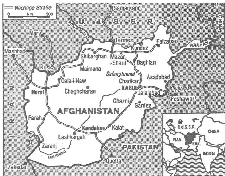
Afghanistan. Bald nur noch ein weißer Fleck auf der Karte?

Man sagt den Rekruten vor ihrem Einsatz, sie würden gegen amerikanische und chinesische Söldner kämpfen, und sie müssten die südliche