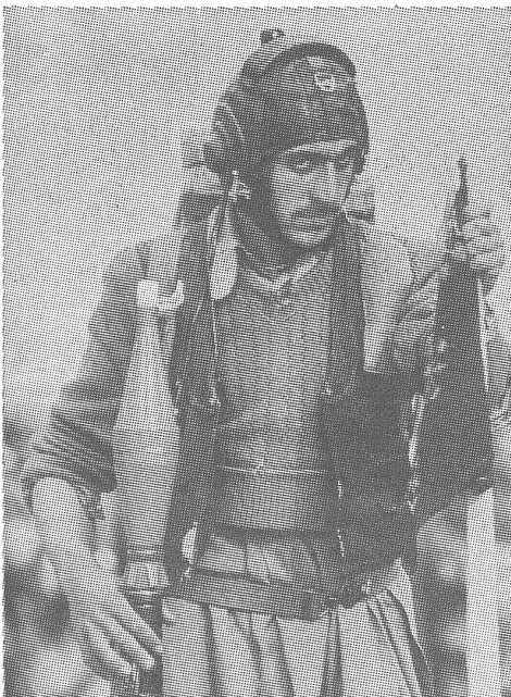
Partisan mit erbeutetem Helm eines sowjetischen Panzerschützen.

Das ist offenbar unterschiedlich. Die afghanischen Kommandanten, mit denen ich sprach,