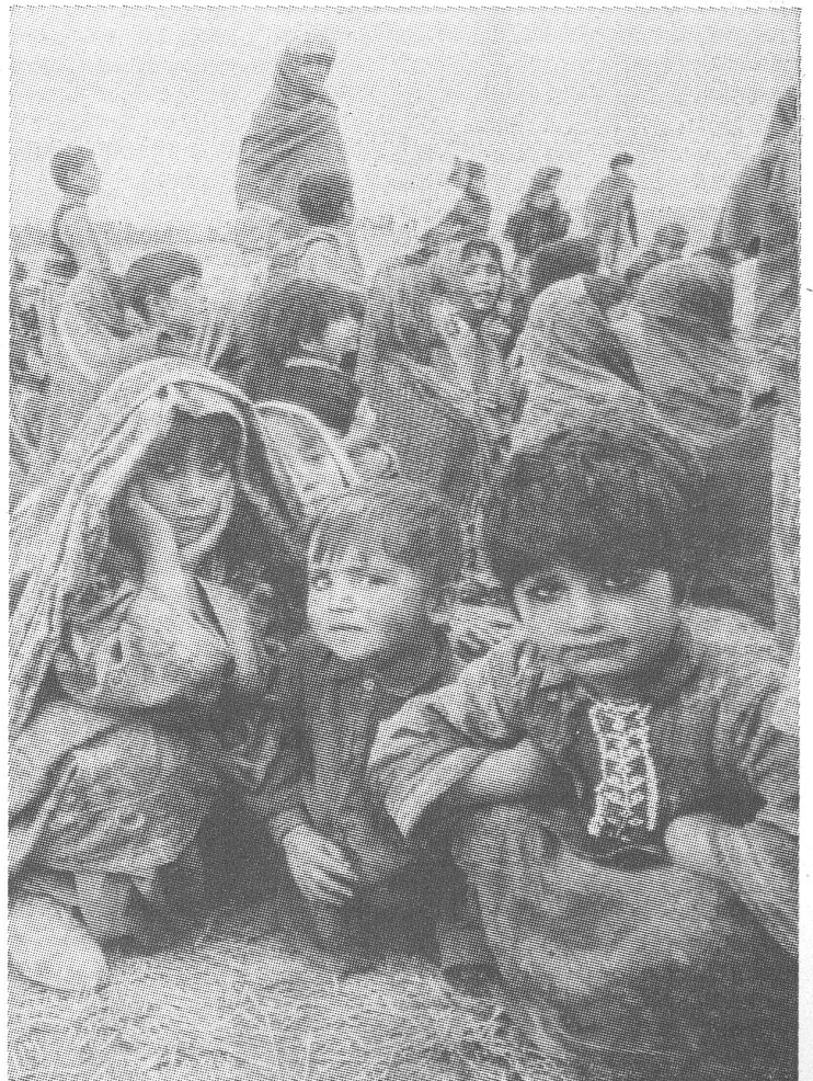
Rund ein Drittel der afghanischen Bevölkerung ist über die Grenzen geflohen, und weitere Millionen haben ihre engere Heimat im Lande selbst verloren.