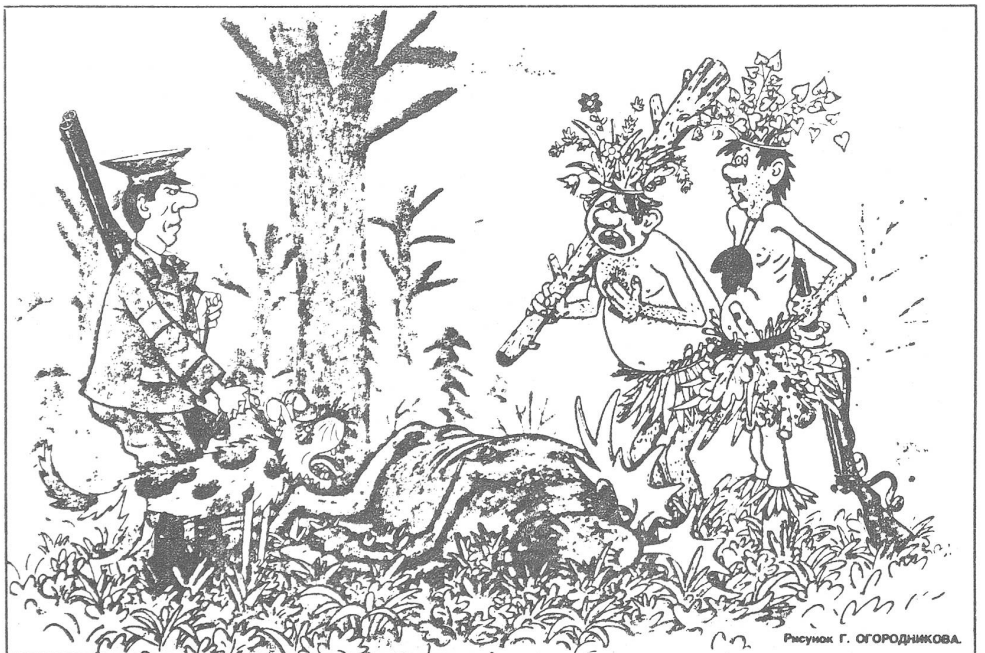
Die «Tarnung» der Wilderer gegenüber dem Jagdaufseher: «Nein, nein, wir sind Eingeborene und suchen unsern Stamm.» («Krokodil», Nr. 19/1983)

Radio Eriwan hat auf die Frage, ob es gerechtfertigt sei, dass man die Nichttrinker als suspekte Elemente betrachte, die adäquate Antwort gegeben: «Im Prinzip ja. Sie könnten ja Spione sein, diese Ausländer.»