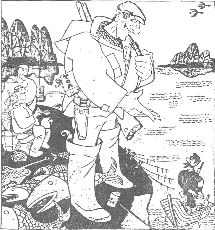
Der Schwarzfischer (mit dem Sprengstoff-«Tol» – unter dem Arm) zum Fischereiaufseher: «Was darf ich dir anbieten, mein Guter?» («Krokodil», Moskau, Nr. 25/1983)

Gerade die ideale Illustration zum nebenstehenden Prozessbericht.