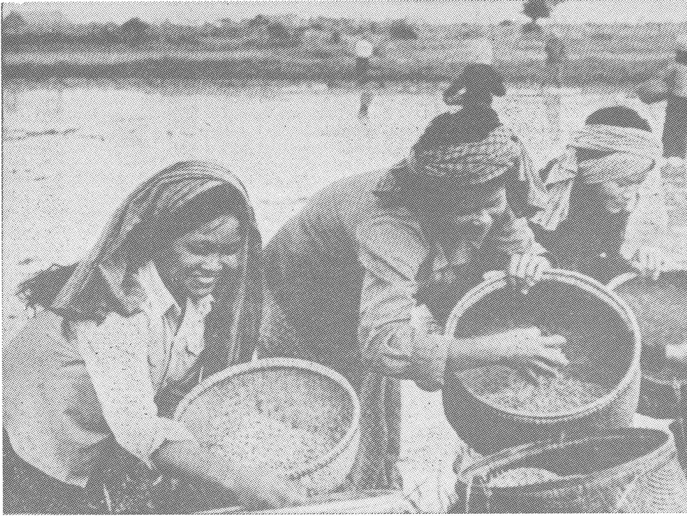
Von den besten Feldern vertrieben: Reisbauern in Kambodscha (Kampuchea).

bek, Svay Rieng, Koh Thom, Prek Sandek und Kirivong auf. Weitere Ansiedlungen wurden rund um den grossen Tonle-Sap-See im Innern des Landes, an der Küste sowie an Flussläufen in den Distrikten Peam Chor, Leuk Dek, Koh Thom, Prey Kabas, Angkor Borei und Prek Sandek registriert. Letztere sind vorwiegend auf den Fischfang hin orientiert. Den Vietnamesen wurden deshalb die Fischerei-Rechte dieser Gegenden vorbehalten, unter gleichzeitigem Verbot von Jagd und Fischerei für die dort lebenden Khmer.