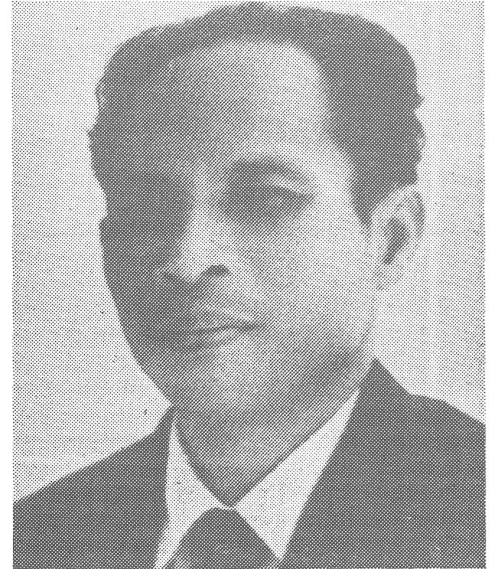
Partei- und Staatschef von Hanoi und Moskaus Gnaden: Heng Samrin.