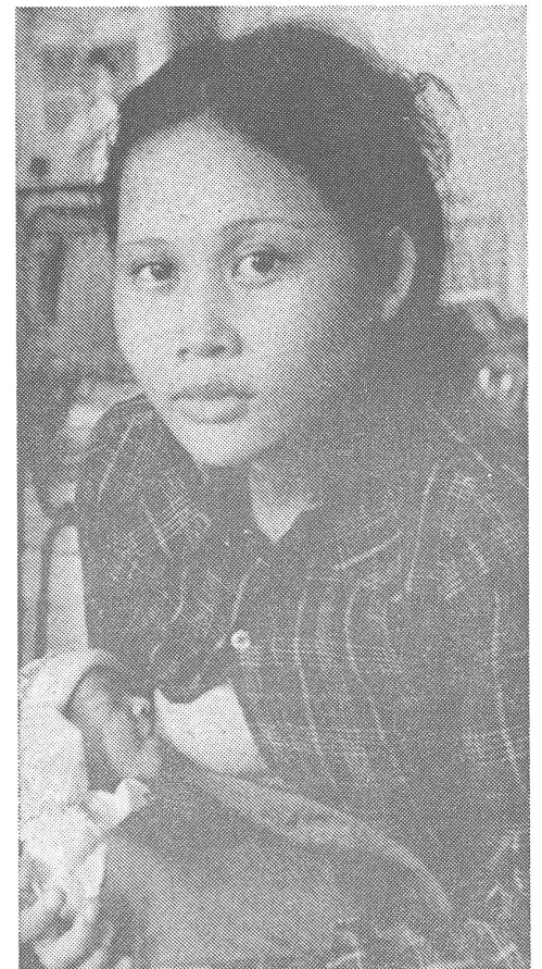
Kambodschanische Mutter mit Kind. Minderheitliche Zukunft im eigenen Land?