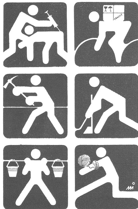
Signalisationsvorschläge für kleine Privatunternehmen. («Ludas Matyi», Budapest, 8.9.1983; alle Karikaturen zu unserem Beitrag sind dieser ungarischen satirischen Zeitschrift entnommen.)

Die Zahl der privaten Geschäfte und Gaststätten hatte sich schon 1980 auf 13000 belaufen; inzwischen ist sie auf gut 17000 gestiegen. (Immerhin muss man bei diesen absoluten Zahlen immer auch die Proportionen sehen: der Anteil der Privaten am gesamten Detailhandel beträgt 3,5 Pro-