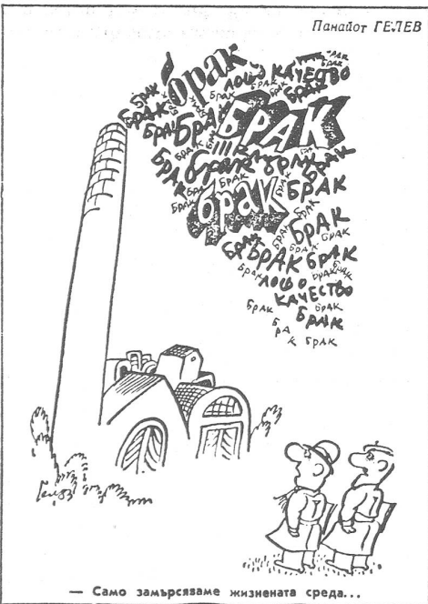
Aus dem Fabrikamin strömt «Ausschuss»: «So beschmutzt man die Umwelt.» («Rabotnitschesko delo», Sofia, 31.8.1983)

Das gilt auf jeden Fall wenigstens für die Zementfabrik bei der Ortschaft Zlatna Panega. Dort sind Elektromotoren in Betrieb. Das heisst, sie waren es bis Ende 1982 ununterbrochen seit 10 Jahren. Dann wurden sie ablösungsreif, und man wechselte sie aus. Die Elektromotoren der neuen Generation taten dann ihren Dienst – wenn auch gar nicht mehr ununterbrochen – bis zum Juli dieses Jahres. Da die Reparaturen nicht viel halfen, bestellte man einen neuen Set. Und das erste gelieferte Exemplar stellte prompt einen neuen Rekord auf: Bis zu seinem Zusammenbruch benötigte es nur noch ein paar Tage. (Nach «Rabotnitschesko delo», Sofia, 18.8.1983)