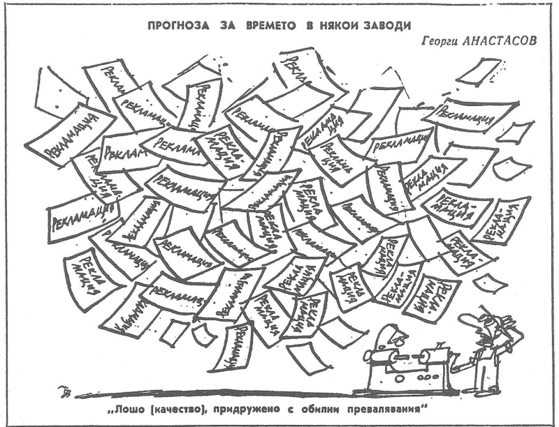
„Лошо [качество], придружено с обилие превалвания“