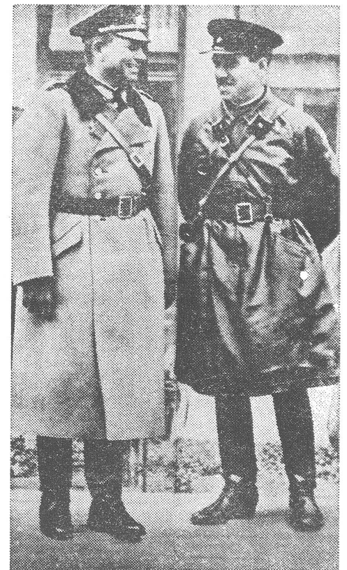
Polen 1939: In Brest-Litowsk schloss sich die deutsch-sowjetische Zange. Hier begegneten einander der reichsdeutsche Panzergeneral Guderian und der sowjetische General Kriwoschein als Waffenbrüder. Man sieht sie hier vor der Abnahme der gemeinsamen Militärparade.

Und in diesem Sinne war dann tatsächlich damals auch die Friedensbewegung im Westen tätig. Wie gesagt: September 1939. Man sollte seiner im Interesse des Friedens wirklich gedenken. pui