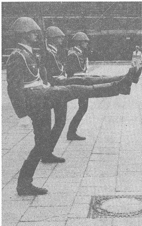
Wachablösung Unter den Linden in Ostberlin. DDR-Soldaten im Stechschritt. Und zwar ausgerechnet vor dem «Mahnmal gegen Faschismus und Militarismus». Da passt der Stiefel genau.

südkoreanischen Zivilflugzeuges lieber nicht äussert;