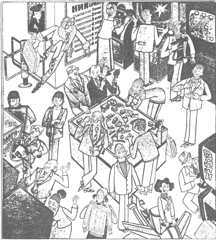
«Seit wir in der Eingangshalle die Spielautomaten aufgestellt haben, gibt es weniger Absenzen im Betrieb.»