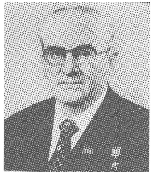
Partei- und Staatschef Jurij Andropow, der Antireformer auf Verbesserungskurs. Aber seine Wirtschaftskritik hat den Reformbefürwortern den Vorwand gegeben, ihrerseits nicht nur Verbesserungen zu fordern, sondern auch Veränderungen.

über die liberalen Neigungen und die Reformfreudigkeit Andropows bestens orientiert sind, hat er selbst das Wort «Reform» nicht gebraucht. Er hat auch nichts von «radikalen Veränderungen des Wirtschaftssystems» gesagt (ein Wunsch, der ihm lediglich im Westen unterstellt worden ist), sondern bloss von «Verbesserungen des Wirtschaftsmechanismus» gesprochen. Das ist nicht nur ein Unterschied der Wortwahl, son-