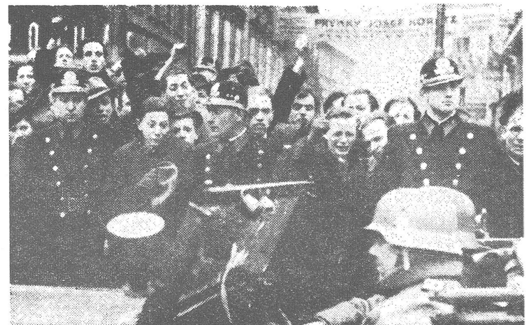
Integration durch Anschluss und Protektoratsbildung, 1939 wie 1968 beim Einmarsch in die Tschechoslowakei. Zur Aufnahme links schrieb damals «Vjesnik» (Zagreb): «Ein Bild, das an 1939 erinnert. Diesmal aber gehören die waffentragenden Soldaten unter den Helmen der Sowjetarmee an.» Rechts der deutsche Einmarsch von 1939.