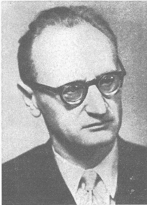
Schon im Mai 1968 in Moskau von Gromyko daran erinnert, dass die Sowjetunion bis zur Westgrenze der Tschechoslowakei reicht: CSSR-Aussenminister Jiri Hajek.