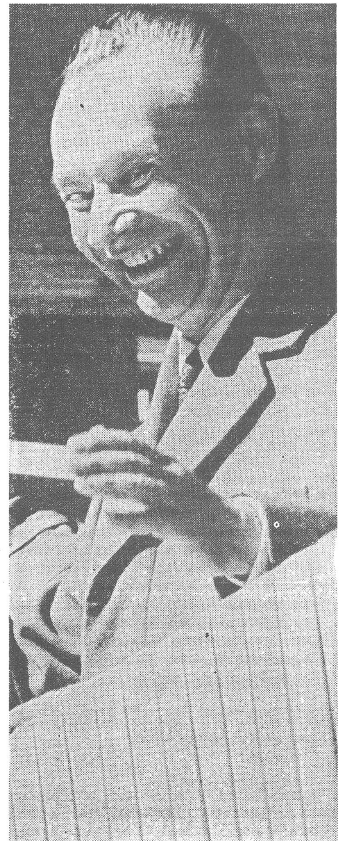
Dubcek (an der Maiparade 1968). Er wollte ein liberalisierender Kadar sein, als es eines entschlossenen Titos bedurfte hätte.

Breschnew schlug einen jammernden Ton an. Was für einen Schaden wir doch angerichtet hätten! Was hätten die Sowjetmenschen doch alles für uns getan, und was sei jetzt der Dank dafür? Er brachte Zitate aus unsern Zeitungen und sagte, das alles sei antisowjetische Propaganda und