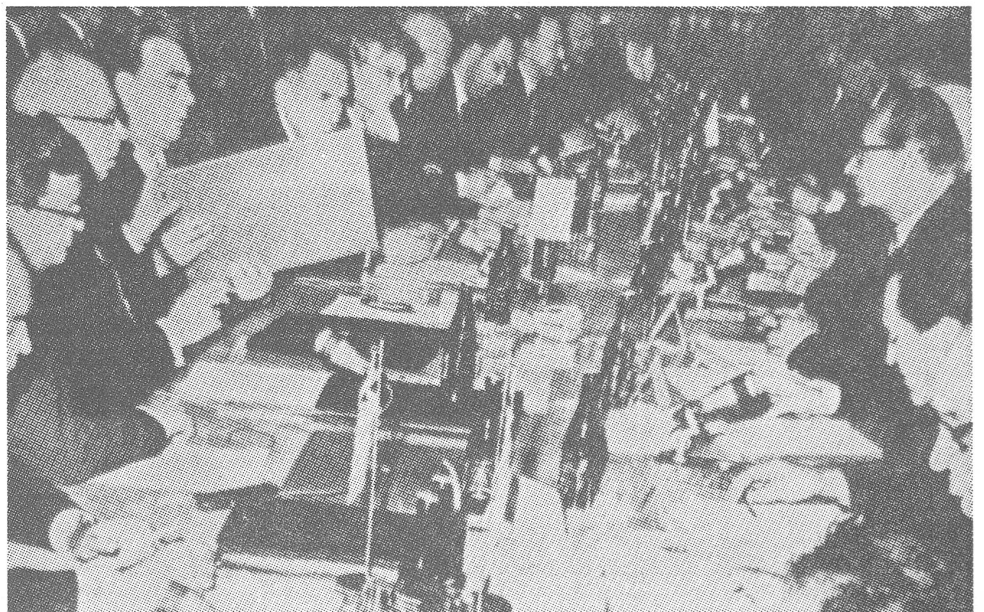
Die Konferenz von Bratislava am 3. August 1968. Dubcek (dritter von rechts mit Brille) sitzt Breschnew gegenüber.

Ein interessantes, angenehmes Erlebnis hatte ich auch. Am 9. Mai gab es auf der CSSR-Botschaft in Moskau einen Empfang zu unserem Staatsfeiertag, und Hajek stellte mich dem seinerzeitigen Sowjetbotschafter in London während des Krieges vor, Iwan Majskij, der eben ein Buch geschrieben hatte. Als ich mit ihm darüber sprach, führte er mich zum offenen Fenster, schaute sich links und rechts um, erzählte von seiner Ehrfurcht für ( den 1948 durch den kommunistischen Staatsstreich gestürzten tschechoslowakischen Präsidenten ) Benes und ( den damals durch einen als Selbstmord kaschierten Mord umgebrachten Aussenminister ) Jan Masaryk. Er liebe unser Volk und halte uns jetzt beide Daumen. Das tat wohl. Aber es war nur ein warmer Tropfen in der kalten Dusche.