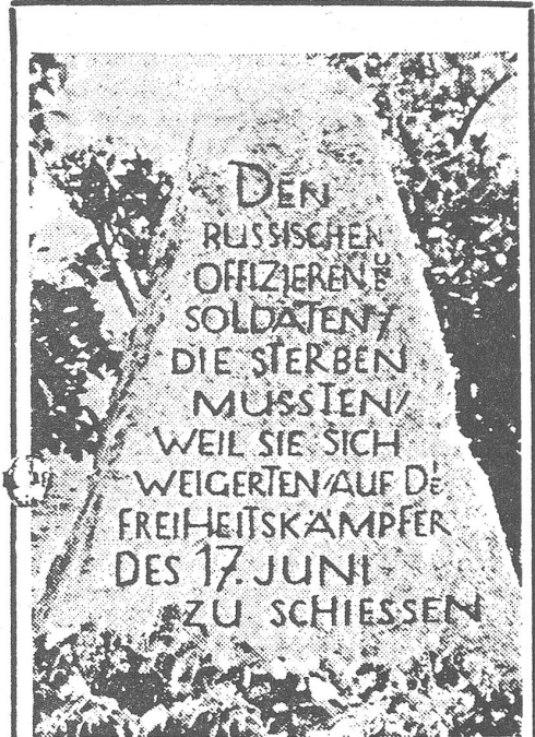
Gedenkstein in der Potsdamer Chaussee

Einige nicht so genannte Konzessionen machten die Sowjets 1953 nachträglich in wirtschaftlichen Belangen. Bald nach dem Aufstand verzichtete die UdSSR der DDR gegenüber auf Kriegsreparationen und gab einige beschlagnahmte Werte frei. In der DDR selbst zog die Regierung ihre Normenerhöhung zurück. Laszlo Revesz