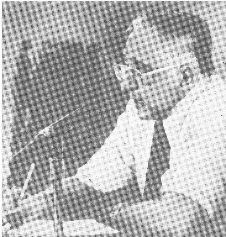
Dr. Guillermo Manuel Ungo, Chef der FDR, jener politischen Guerilla-Dachorganisation, die von Fidel Castro aus der Taufe gehoben wurde.

optimale Betriebsgrösse auf und erarbeiten den grössten Anteil des Devisenerlöses aus dem Agrarexport.