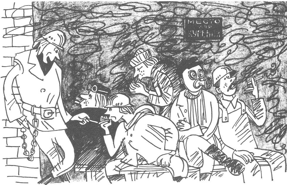
Die Raucherecke im Betrieb. «Doch ein rechter Kollege, der Iwanow. Er raucht zwar nicht, aber er sitzt doch den ganzen Tag mit dem Kollektiv zusammen.» («Krokodil», Moskau, Nr. 11/1983)