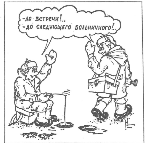
«Also dann bis nächstesmal, wenn wir wieder krank sind.» («Trud», Moskau, 8.1.1983)

In diesem direkten und indirekten Zusammenhang mit Polen ist wohl das neue Belegschaftsgesetz in der Sowjetunion zu sehen. Es trägt der uneingestanden Tatsache Rechnung, dass der Arbeiter die Gewerkschaft nicht als Vertretung seiner Interessen empfindet und dass er sich im Betrieb ohnmächtig vorkommt. Man will das Be-