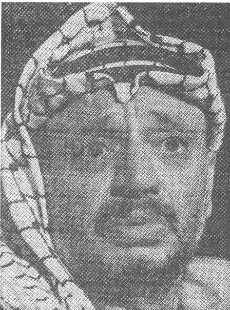
War in den letzten Wochen unter anderem mit einer Rebellion bei seinen PLO-Streitkräften Fatah konfrontiert: Jassir Arafat.

Sie machen Ihren Korrespondenten darauf aufmerksam, dass man die Deutschen nicht mit den Nazis, die Russen und übrigen Einwohner der UdSSR nicht mit den sowjetischen Machthabern, die Polen nicht mit ihrem Regime verwechseln dürfe, womit ich übrigens vollkommen einverstanden bin. Bei Ihren weiteren Ausführungen musste ich aber mit Verblüffung feststellen, dass Sie entgegen Ihrer Einleitung offenbar keinen Unterschied zwischen Palästinensern und PLO machen, weil Sie beide Begriffe synonym verwenden. Mit scheint, Sie sündigen hier gegen Ihr eigenes Gebot, oder ist mir da etwas entgangen?