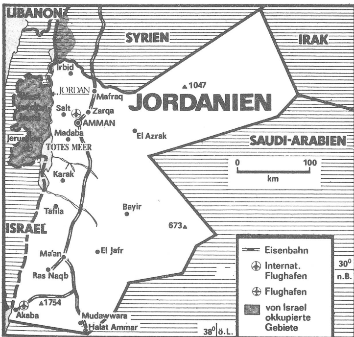
Das Kernstück eines künftigen Palästinenserstaates: Westjordanland (Cisjordanien).