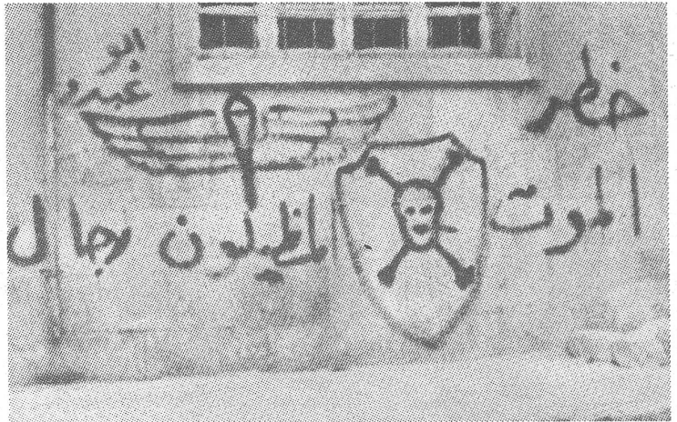
An dieser Mauer in Hama führte man nach dem Aufstand vom Februar 1982 Massenhinrichtungen durch.

die Gewalt zum Alltag. Staatlicher und gegenstaatlicher Terror, Verschwörungen, politische Morde und Attentate beherrschen die Szene.