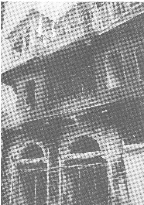
Hama nach dem Sturm 1982.

Zum Beispiel in der Friedensfrage. Es gibt PLO-Gruppierungen, die eine friedliche Lösung des Palästinaproblems für versuchenswert halten,