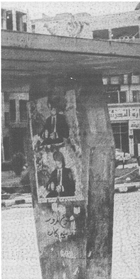
Angeschossene Assad-Bilder bei der Busstation von Hama.

Ich hätte mir natürlich auch sonstige Fracht aus der UdSSR vorstellen können. Aber an diese Möglichkeit dachte der Syrer offenbar nicht einmal.