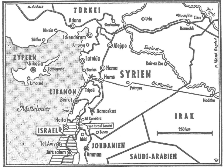
Karte von Syrien. Mit einem Stern bei der Nordgrenze von Libanon ist die im Text erwähnte Kreuzritterburg situiert.

ment syrischer Normalisierung; es fällt sofort auf. LP ist hier rar. Offenbar ist ihm im Falle von Hama etwas Diskretion ratsam erschienen. Man muss ihm beipflichten, wenn man sieht, wie auf einigen seiner Bilder die Augenpartie ausgeschossen ist. Mein Sohn konnte sich nicht zurückhalten, das zu knipsen; sonst waren wir mit Photographieren vorsichtig und haben lieber antike Ruinen aufgenommen als zeitgenössische.