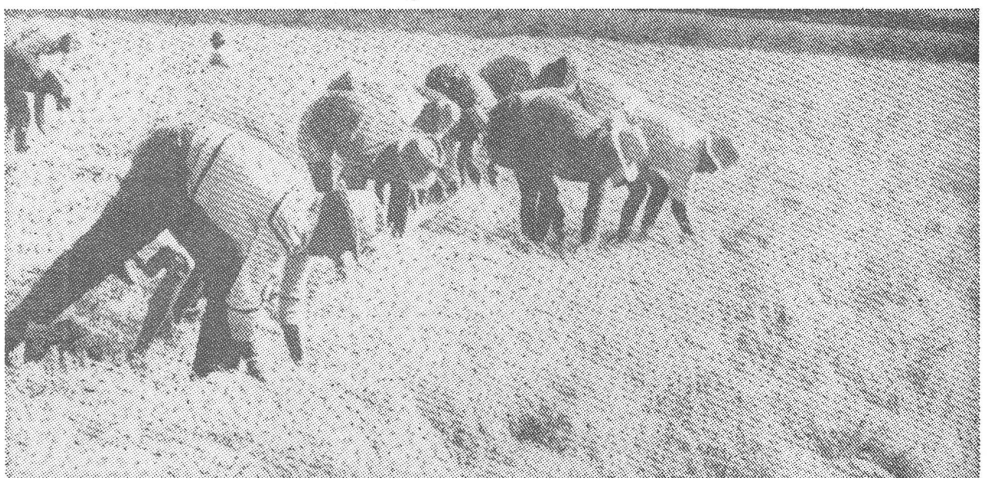
Als sie noch stattfand: Getreideernte in Äthiopien.