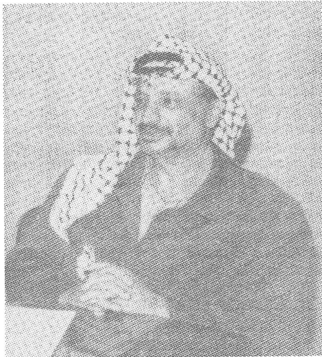
Yassir Arafat, der PLO-Chef, ist nicht nur Gegenspieler Israels, sondern auch der USA in ihren Bemühungen um eine Konfliktlösung. Bei seinem jüngsten Besuch in Moskau meldete er im gemeinsamen Communiqué mit den Sowjets seine Gegnerschaft zum amerikanischen Friedensplan an.