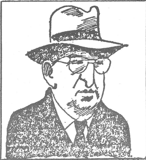
Andropow. («Politika», Belgrad, 8.1.1983)

Tschekin beginnt mit der allgemeinen Erscheinung der «Überalterung». Während die gesamt-sowjetische Bevölkerung jährlich um knapp ein Prozent zunimmt, steigt die Zahl der Rentner pro Jahr um 3 bis 4 Prozent. Noch in der Planperiode 1976 bis 1980 waren für jede abtretende Arbeitskraft zwei neue Kräfte in den Arbeitsprozess eingegliedert worden, aber in diesem Jahrzehnt ist das Verhältnis nur noch 1:1.