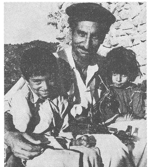
Ein anderer Guerilla-Kommandant mit seinen Kindern.

Das Verbrechen mag in dieser Form die Ausnahme sein (obwohl es der Verbrennungsaktion im Dorfe Pandkhwab-e-Shani ähnelt). Aber in allen seinen Formen summiert sich der Mord an der afghanischen Bevölkerung. Und die internationale Entrüstung? Sie nährt sich dauerhaft vom einen Massaker in Beirut, weil es dort israelische Mitschuld gibt. ■