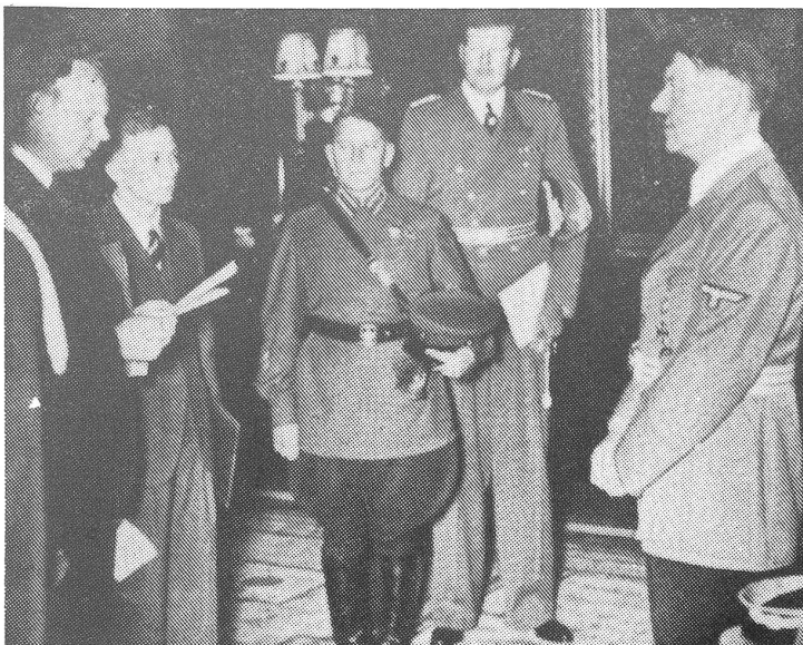
Zur Zeit vom Hitler-Stalin-Pakt 1939: Hitler empfängt den Sowjetbotschafter Schkarszew (links) und General Purkajew, den sowjetischen Militärattaché in Berlin.

Der Volksentscheid gegen die sozialdemokratische Regierung von Preussen endete mit einer