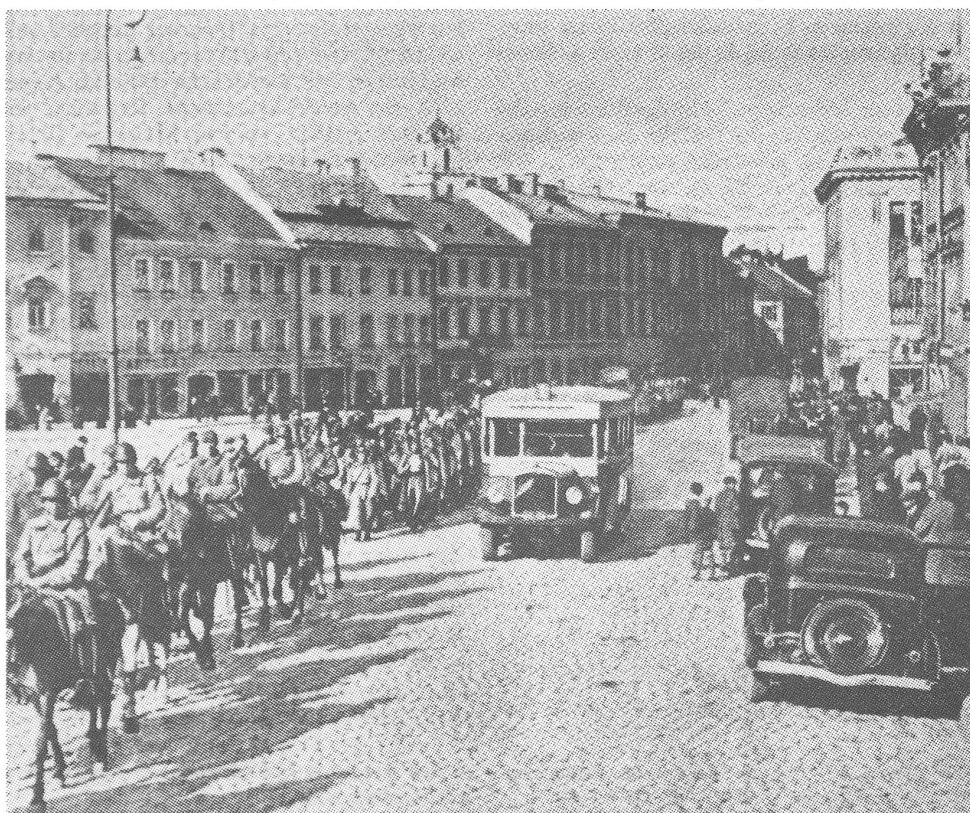
Aufgrund der mit Hitler ausgehandelten Aufteilung Europas marschiert die Rote Armee 1939 in die litauische Hauptstadt Wilna ein.

Am 22. Juni 1941 zerbrach der Pakt. Deutsche Truppen marschierten in die Sowjetunion ein. Stalin musste die von ihm früher beschimpften Westmächte um Hilfe gegen den ehemaligen «Vertragspartner» bitten. Doch das Konzept, auch «Rechts-Links-Bündnisse» herzustellen, wenn es die Taktik erfordert, wurde keinesfalls ad acta gelegt. ■