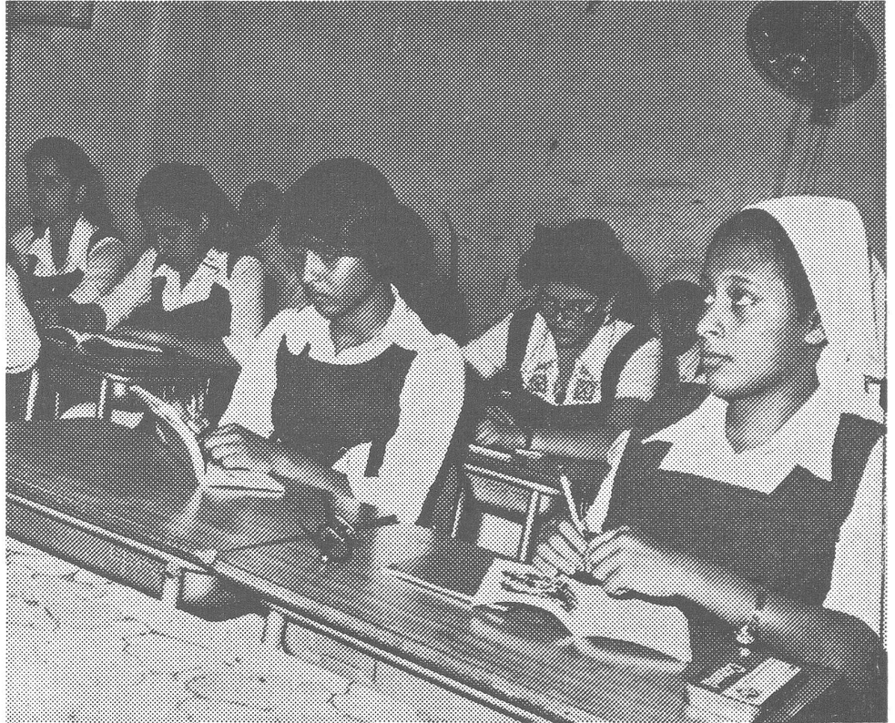
Die Bildung ist in Oman kein Privileg der Männer mehr.

Sultan Kabus ist kein gewählter Regierungs- oder Staatschef, sondern absoluter Monarch, der achte von einer Dynastie, die Mitte des 18. Jahrhunderts an die Macht gelangte. In ihm und in einigen andern glücklichen Ausnahmefällen ist Platons Wunsch in Erfüllung gegangen. Das spricht zwar nicht für die absolute Monarchie, weil sich