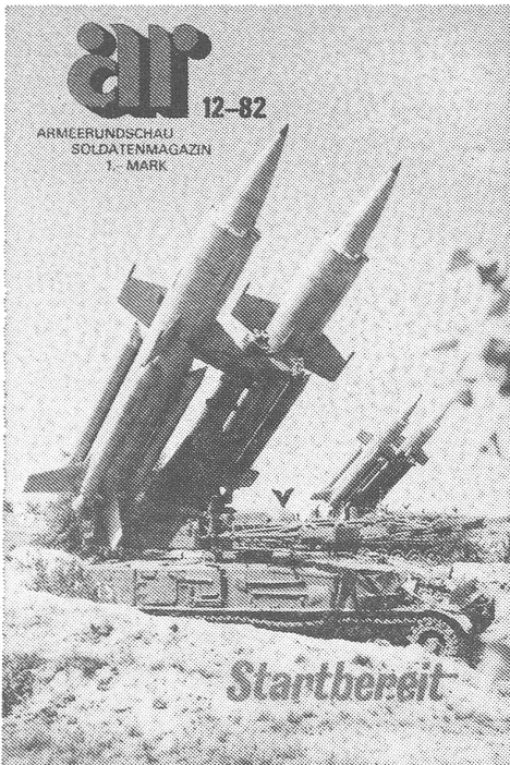
Dezembernummer der DDR-«Armeerundschau» (ar), Titelseite: «Startbereit»!