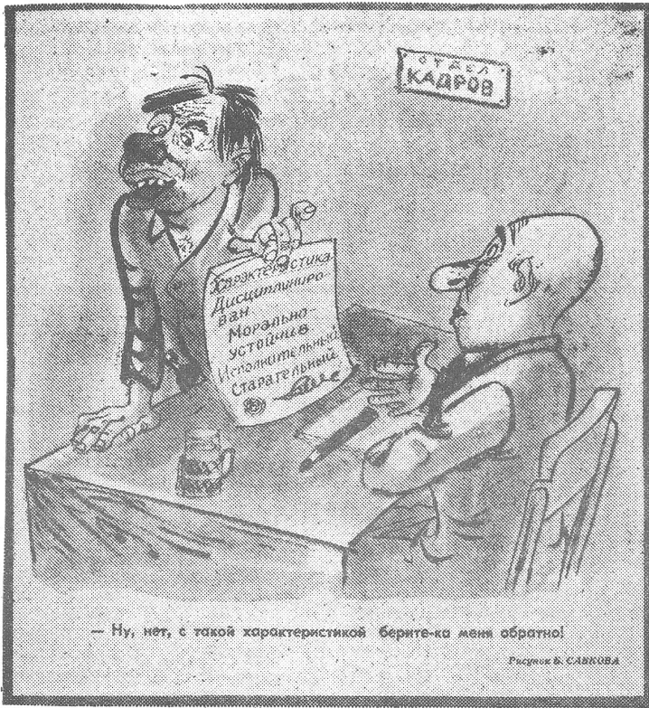
Gerügte Lachheit bei der Verschiebung von Arbeitskräften in der Sowjetunion.

Um schlechte Arbeiter loszuwerden, entlässt man sie gerne mit einer guten «Charakteristik» (Arbeits- und Verhaltenszeugnis).